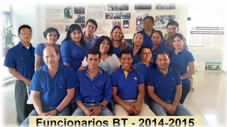
Funcionarios BT - 2014-2015